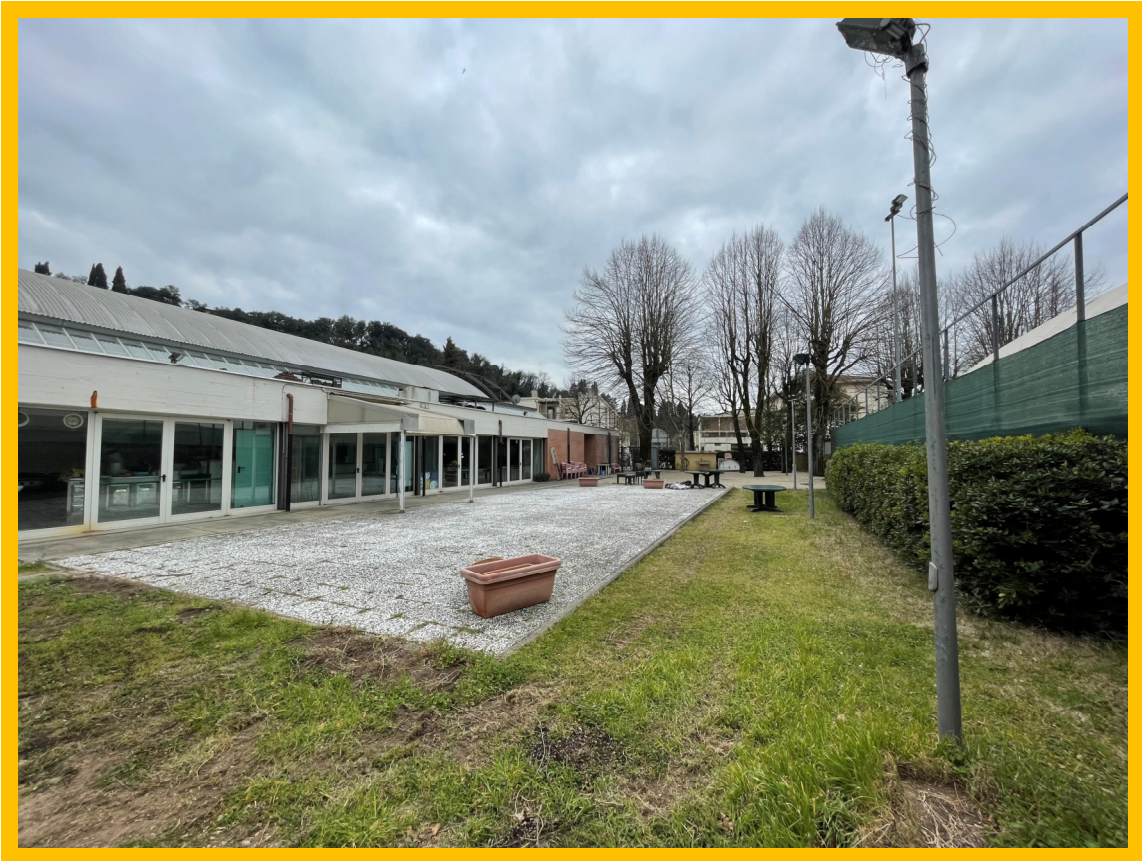
FOTO STATO ATTUALE : Scorcio dell'area esterna adiacente all'edificio della boccioteca con il posizionamento del pergolato.