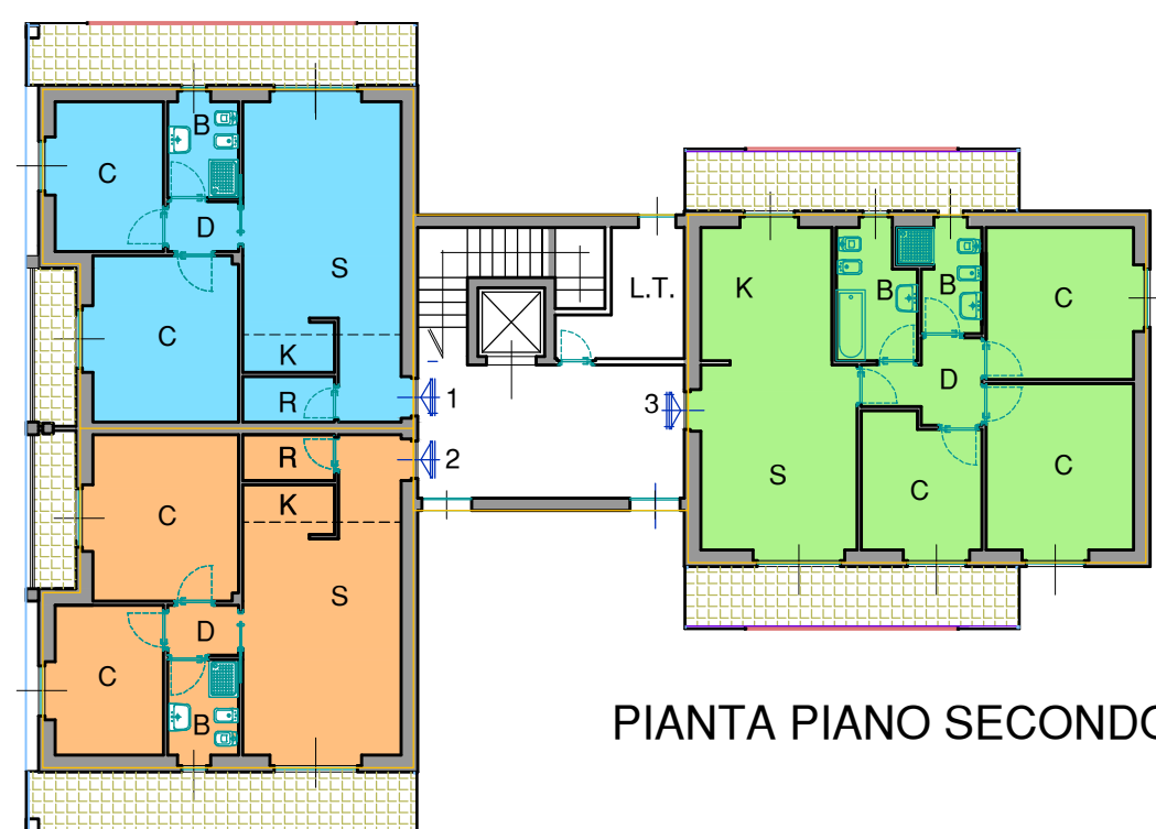
PIANTA PIANO SECONDO