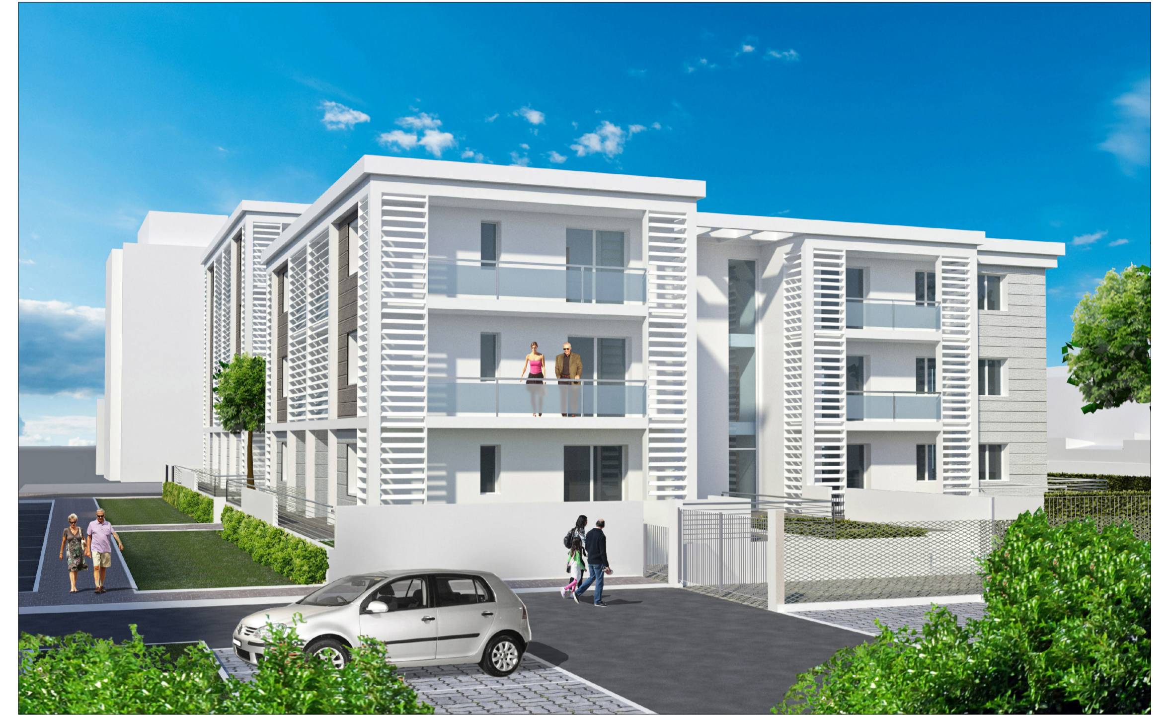
VISTA DA VIA BACCIO DA MONTELUPO DIREZIONE FIRENZE