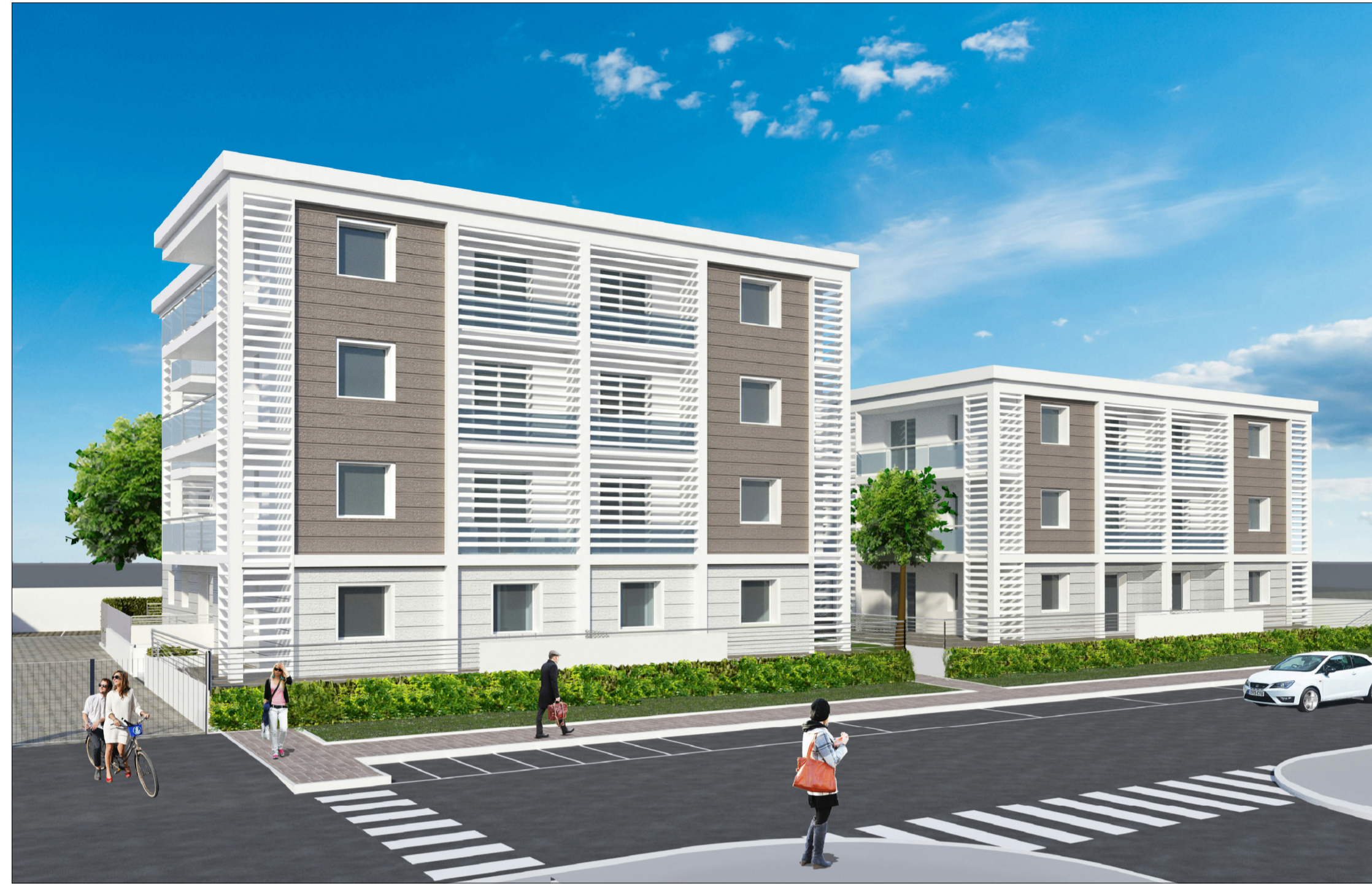
VISTA DA VIA BACCIO DA MONTELUPO