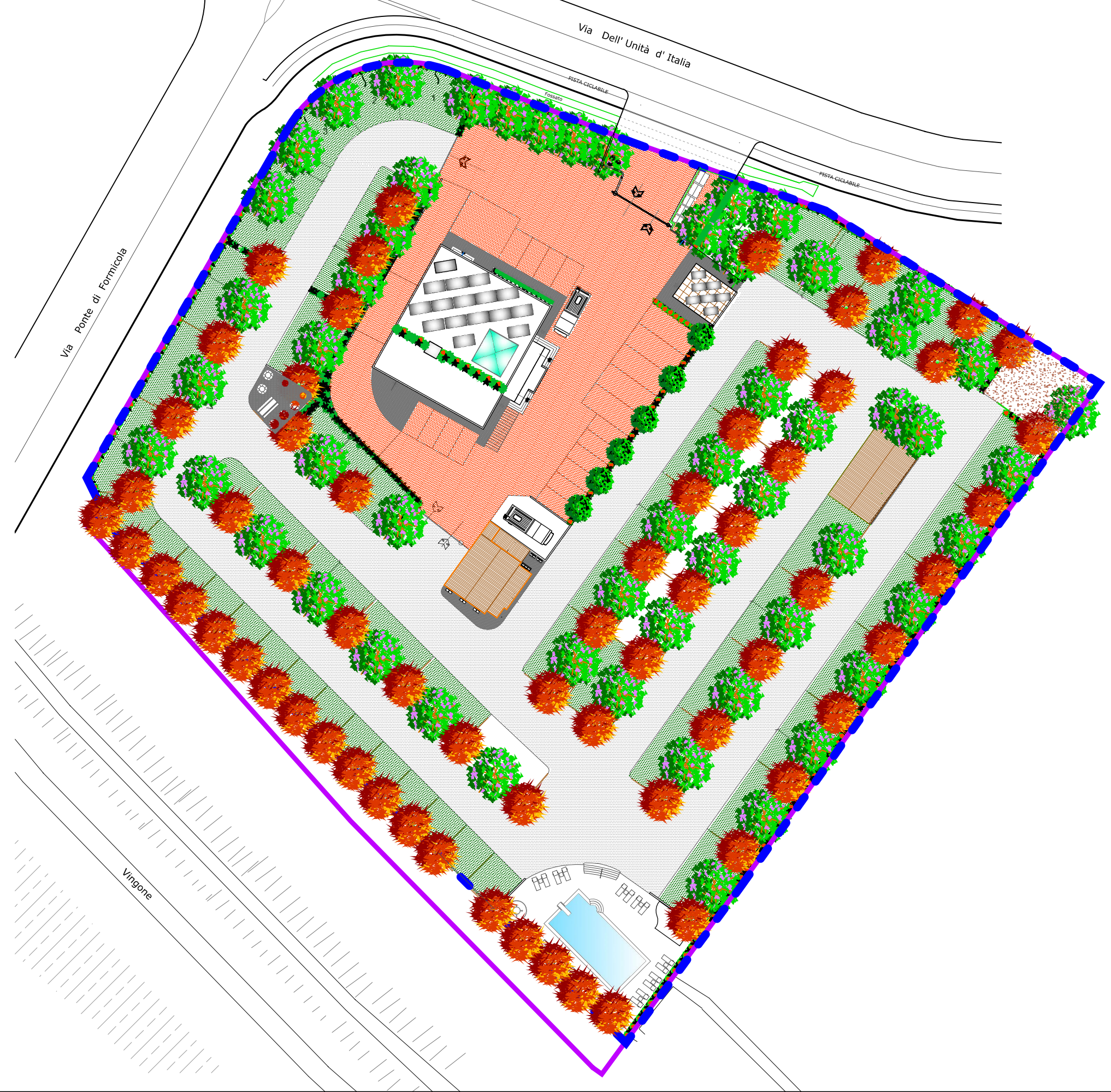
Tavola: 5a PU Data: 14/12/2022

Oggetto: PROGETTO UNITARIO Planimetria generale di progetto (Vista aerea) Scala: 1:600