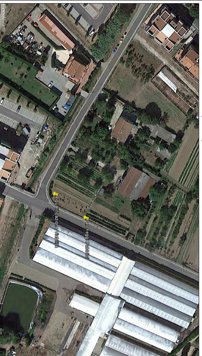
TAVOLA : 14 TAVOLA DI INQUADRAMENTO GENERALE DELLE OPERE DI URBANIZZAZIONE come da PROGETTO DEFINITIVO, approvato con D.G.C. n. 88 del 05/06/2018

Documento informatico firmato digitalmente ai sensi e per gli effetti del DPR 28/12/2000 n.445 e Dlgs 7/03/2005 n.82 e norme collegiate